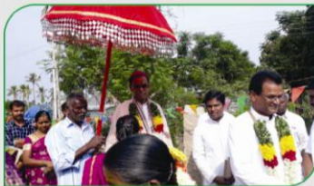
Confirmation, Billigundu 17.05.2019