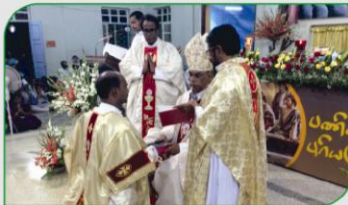
Feast of St Antony, Bellagiri 12.05.2019