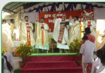
Feast of St Sebastin, Poolapatti 14.05.2019