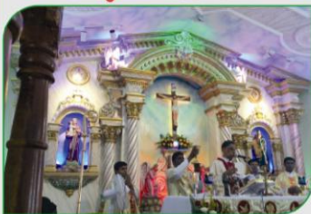
Confirmation, Denkanikottai 12.05.2019