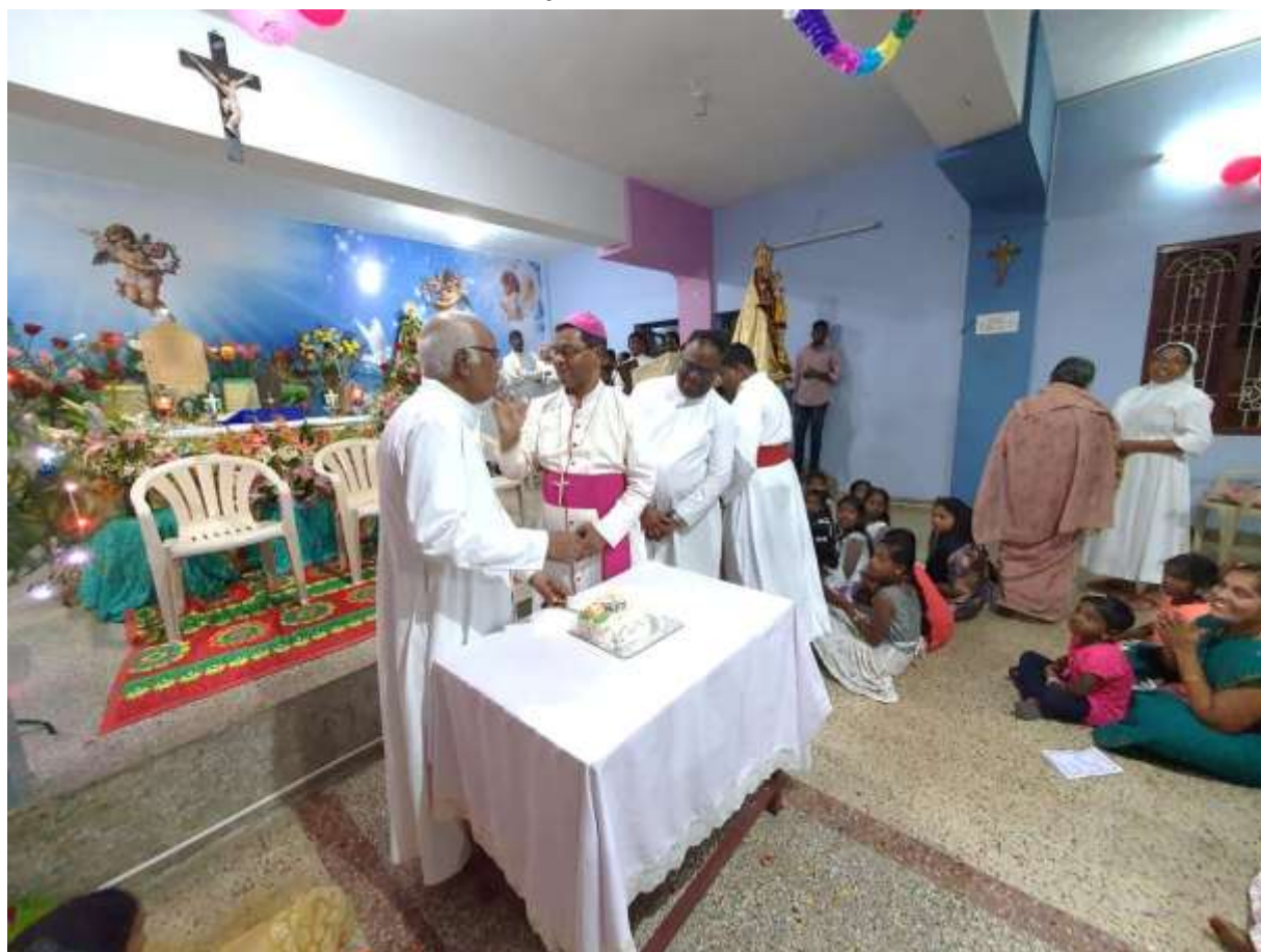
Blessing of the Parish Church in Gnanapragasiarpatnam (29.12.2019)