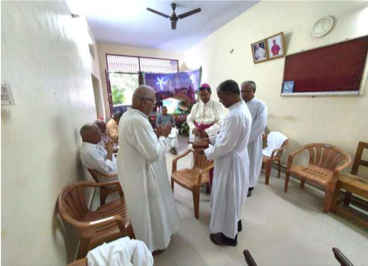
First Friday Felicitation in Alanthalai (03.01.2020)