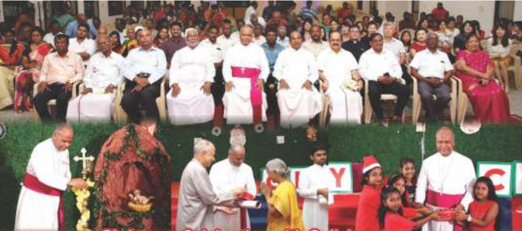
Christmas Celebration with Collaborators

ஆரஞ்சு நிறம் இவ்வாறின் சிறப்பினை, ஆற்றலை, வலிமையை சுட்டுகிறது. சுவர்வல்லிக் இவ்வாறில் பருவத்தை இளைஞர்கள் நற்செய்திக்கான எண்ணின் ஊடகமாக நேர்த்தியோடு உருவாக்கத் தூண்டுகிறது.