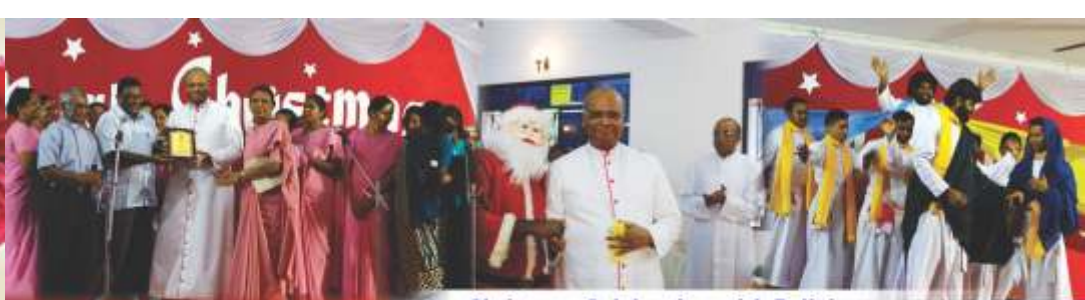
Christmas Celebration with Religious