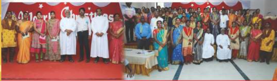
GB Meeting & Christmas Celebration – Anbiyam Commission